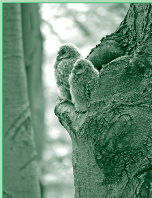
▲ Staré stromy sú neodmysliteľnou súčasťou prirodzených lesov. Poskytujú úkryt mnohým živočíchom, tak ako aj týmto mláďatám sovy dlhochvostej.