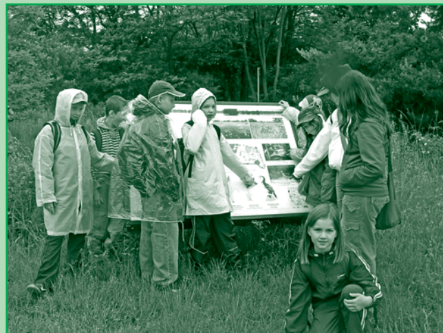
▲ Žiaci minuloročnej víťaznej školy ZŠ M. R. Štefánika z Ivanky pri Dunaji. Od učenia sa v prírode ich neodradí ani dážď. Ak sa vraví, raz vidieť, je lepšie, ako stokrát počuť (alebo čítať).

Ak ste ešte nemali na škole výstavu fotografií so sprievodným textom Po nás potopa, alebo filmy Znovuzrodenie lesa a Divoké Karpaty, zapožičiame vám ich. Po Dni Zeme budeme mať k dispozícii na zapožičanie aj jedinečný dokumentárny film Strážca divočiny, ktorý približuje život medveďov a divočinu v Tichej doline. Je to unikátny projekt, za ktorým sú tri roky tvrdej práce jeho tvorcov. Všetky zábery, ktoré vo filme uvidíte, sú autentické, natočené priamo v tatranskej divočine. Viac informácií nájdete na www.arollafilm.com .