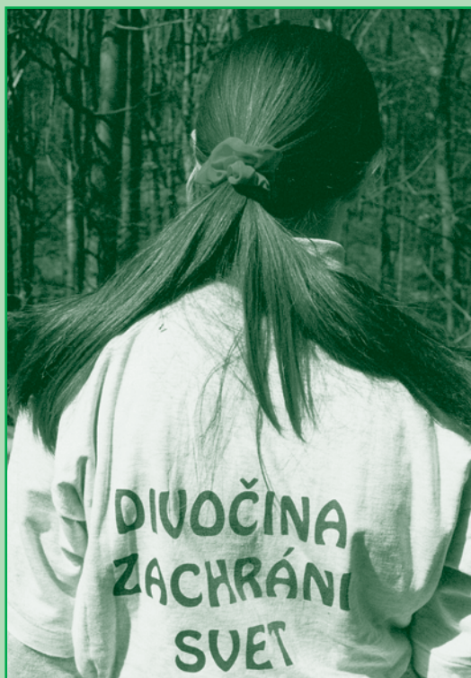
▲ Úvodná fotografia výstavy Divočina zachráni svet.