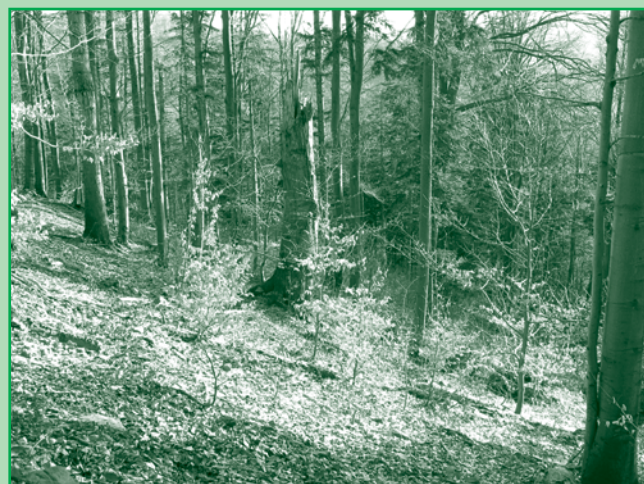
▲ Aj vďaka vašim príspevkom sa už podarilo prikúpiť v Čergove ďalších 18,28 ha lesa za 54 414 €.